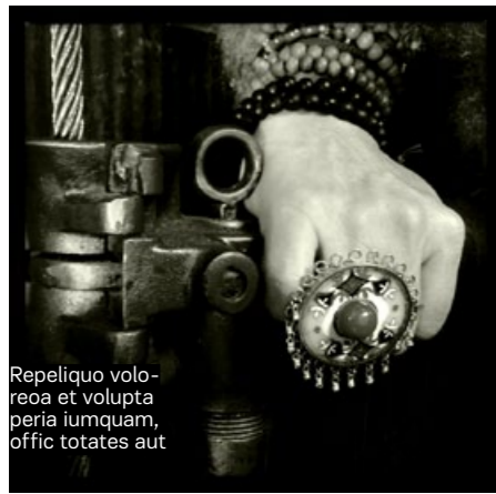
Repeliquo voloreo et volupta peria iumquam, offic totates aut