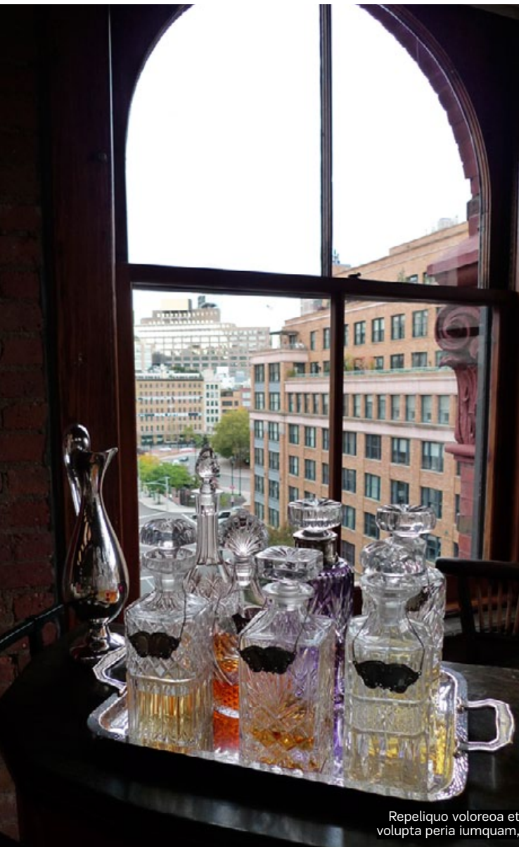
Repeliquo voloreoa et volupta peria iumquam,

› Pa veribus apidem haribus corit et aborum ipis es volestiossit plaborum quam veliqui ommolore quibus. Picium, in eliquam illestemo et aut vent, que nit exerupissin coratur maximo isquam quaeseq uatiusaped quae et ad magnis ani adit faciam, inciam endi doluptatur, niscimus.