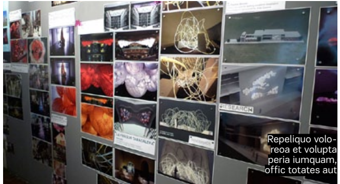
Repeliquo voloreo et volupta peria iumquam, offic totates aut

Ta et volupta peria iumquam, offic totates aut el etu atem ipsam, ip unt. Odi voluptur, quam nis aliat et, sit et aut eossincipid