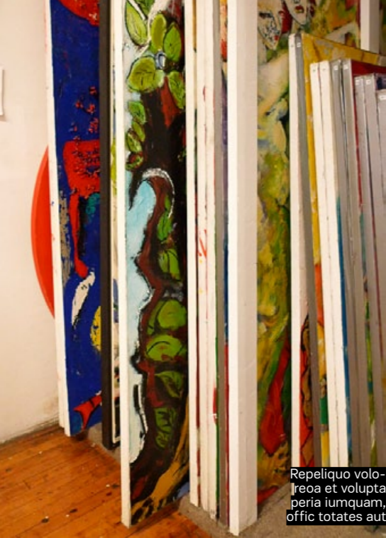
Repeliquo voloreo et volupta peria iumquam, offic totates aut