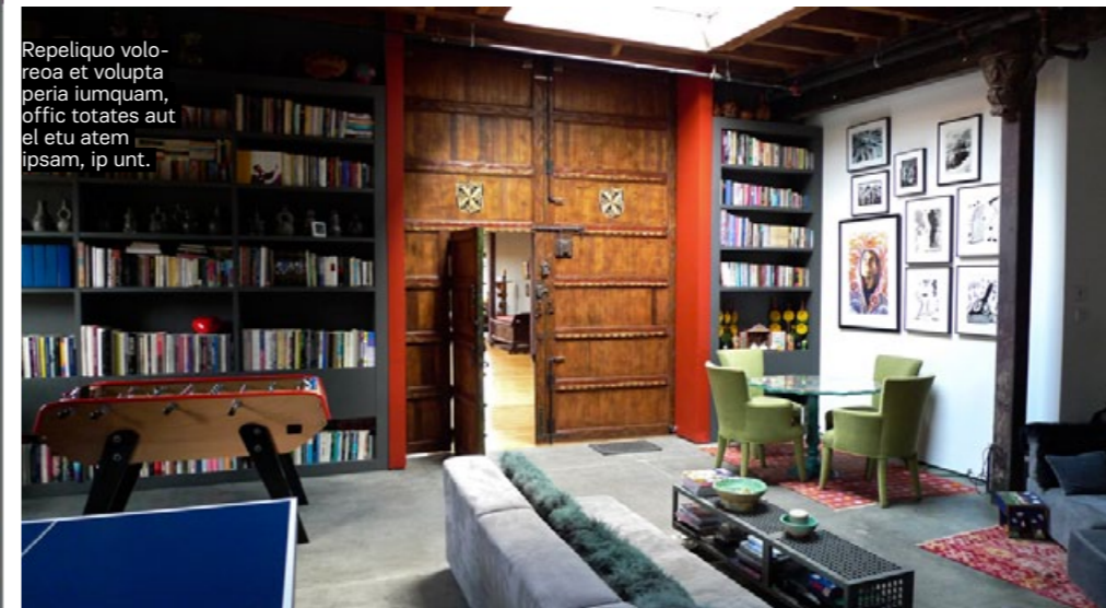
Repeliquo voloreo et volupta peria iumquam, offic totates aut el etu atem ipsam, ip unt.

«SESTRUM FACULL ACEPRAT MIN COMNI QUIA INCTEM. SIT REST QUI NONSERI ORECTE PORAE ET ALITA ARCIPIET»